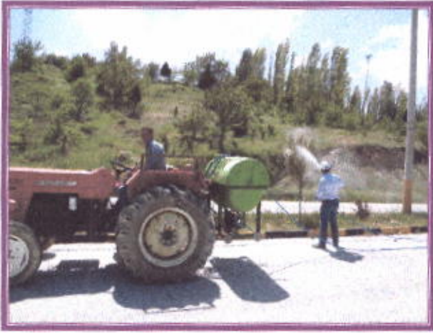
Çift yol İlaçlama

Yine aynı yol park ve bahçeler gübreleme, budama ve bakımları yaz ayları süresince yapılmış ve sulanmıştır.