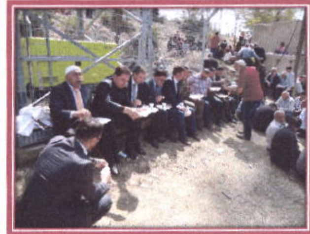
Yağmur duasında toplu yemek yenmesi