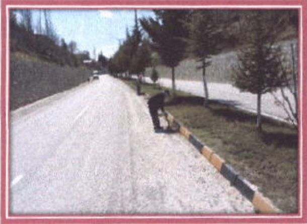
İlçemiz Girişi Çift yolun Temizlenmesi.