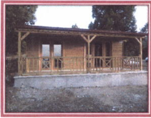
Bungalow Yayla Evleri Dış Görünüşü

İlçemiz Kemer Akpınar Yaylası Asarcık mevkiinde Belediyemiz ile Baka işbirliği ile yapılan Bungalow ahşap yayla evleri, çevre düzenlemesi ve altyapı (kanalizasyon ve içme suyu) toplam 449.891,41.-TL tamamlanarak hizmete sunulmuştur.