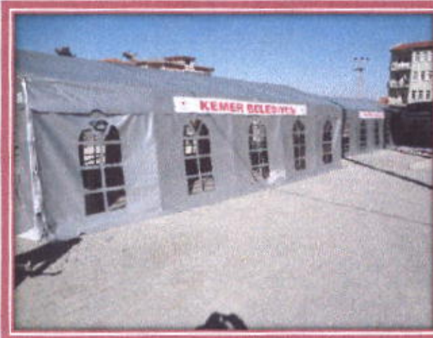
Taziye Çadırı dış görünüşü