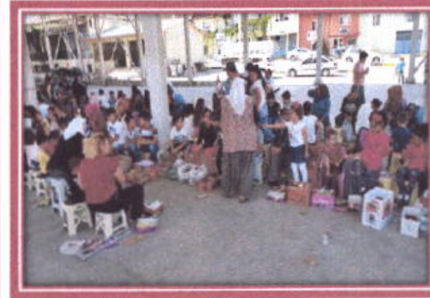
Kapalı Pazar yerinde Bayramlaşma