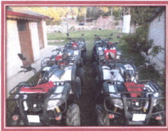
Yayla Evleri ve ATV motorlar