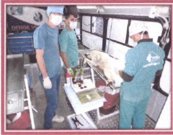
Başı boş köpeklerin kısırlaştırılması

Kemer Belediyesi'nin başlattığı proje ile Denge Veterinerlik Kliniği ve Kemer Belediyesi arasında imzalanan protokole göre, klinik tarafından toplanan köpekler kafeslere alınarak bekletildi. Bir süre bekletilen köpekler, anestezi ünitesine alınarak kısırlaştırma operasyonuna alındı. Operasyon bitiminde dinlenme bölümüne alınan köpekler, kuduz aşıları, parazit iğneleri ve kulak küpeleri takılarak tekrar doğal ortama bırakıldı.