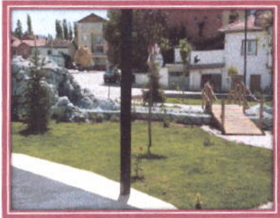
Başkanlar Parkı Şelale