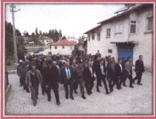
Yağmur Duasına toplu Gidiş

Kemer İlçe Kaymakamlık Makamı ile Kemer Belediye Başkanlığımız tarafından havaların kurak gitmesi nedeniyle vatandaşlarında katılımı yağmur duası yapıldı. İlçemiz Elmalık mevkiinde toplu halde yemek yenmesi, toplu halde namaz kılınması ve toplu halde yağmur yaması için yağmur duası yapılmış en sonunda etkinliğe katılan bayanlar ayrı erkekler ayrı salavatlaşması ile son bulmuştur.