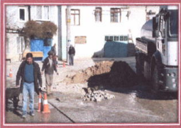
İçme suyunun arızasının giderilmesi