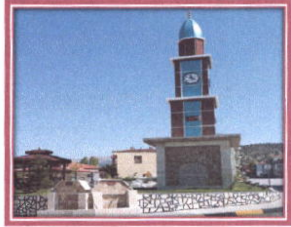
Başkanlar Parkı Saat Kulesi