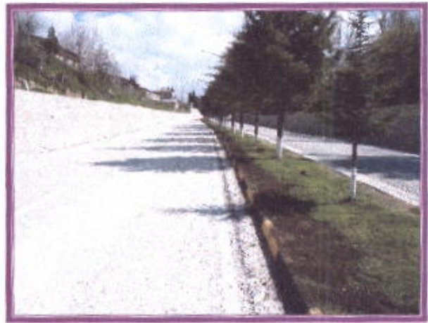
Çift yol Gübreleme ve Bakım