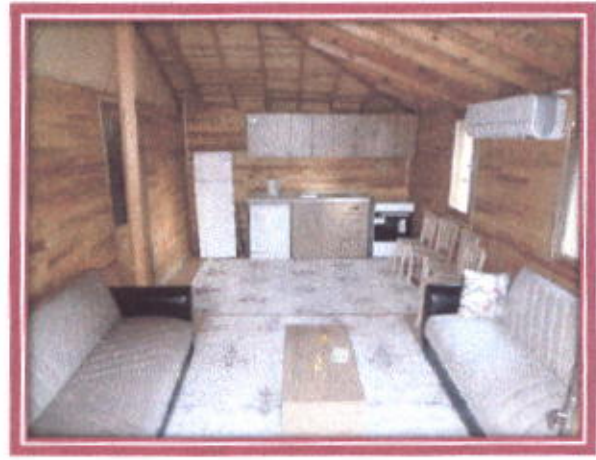
Bungalow Yayla Evleri İç Görünüşü