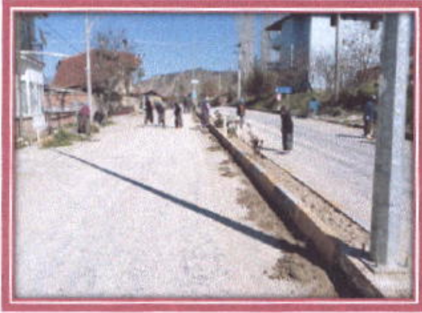
İlçemiz İçerisindeki Yolların Temizlenmesi

Belediyemiz tarafında İlçemiz içerisindeki Park, Bahçe yol kenarları ve kaldırımlar Belediyemizde çalışan İş-Kur İşçileri tarafından Otların biçilerek toplanması, Ağaçların budaması yapılarak çapalanması ve temizlenmesi yapılarak güzel bir görünüme kavuşturuldu.