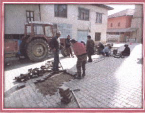
Arızalanan yolların tadilatı

İlçemiz içerisindeki Caddeler ve sokaklardaki yollarda bozulan ve arızalanan parke taşların sökülerek yeniden döşemeleri yapıldı. İçme suyu arızalanan patlayan boruların yapılması ve yine Kanalizasyon arızalarının giderilmesi belediyemiz personeli tarafından yapılmıştır.