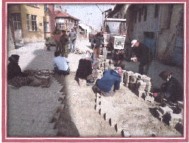
Arızalanan yolların tadilatı