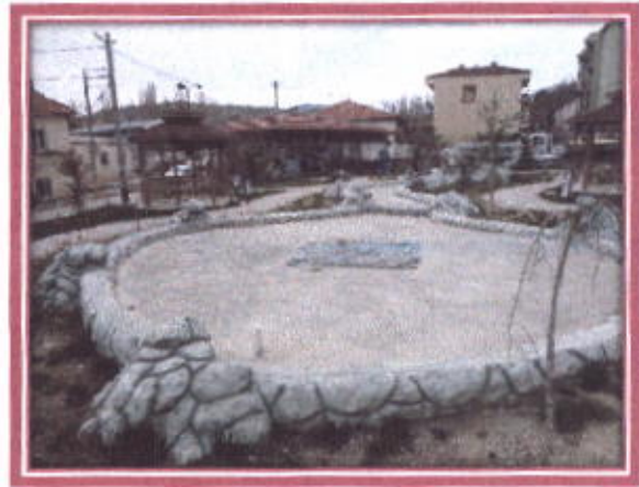
Başkanlar Parkı Su Havuzu Kafeterya