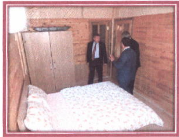
Bungalow Yayla Evleri İç Görünüşü