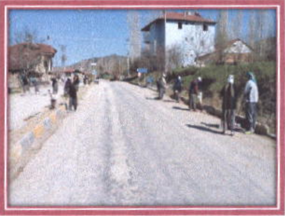
İlçemiz Çıkışı Çift Yolun Temizlenmesi