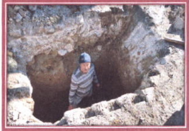
Kanalizasyon arızasının giderilmesi