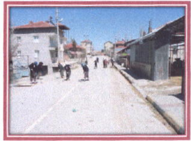
İlçemiz İçerisindeki Yolların Temizlenmesi