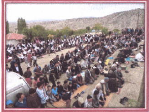
Yağmur duasında toplu halde dua