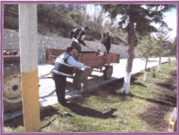
Çift yol Gübreleme ve Bakım