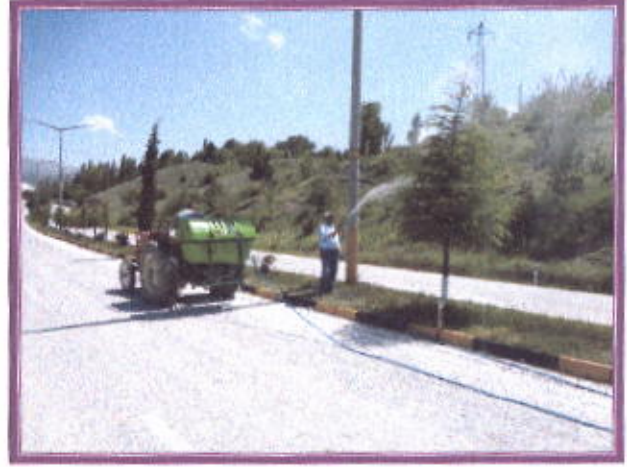
Çift yol İlaçlama