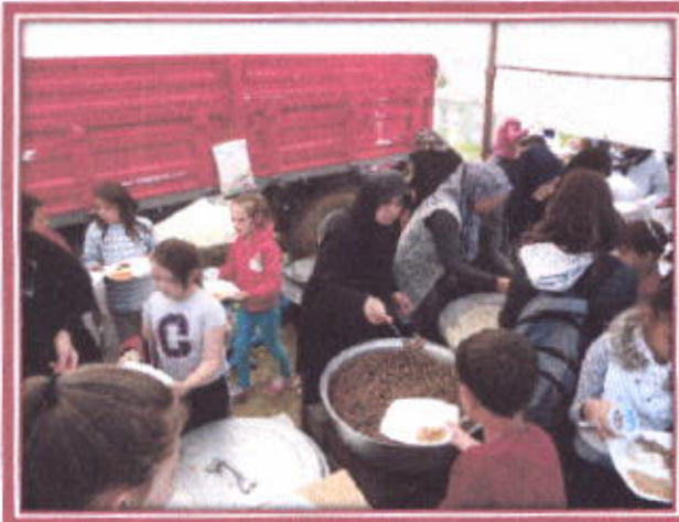
Yağmur duasında toplu yemek dağıtımı