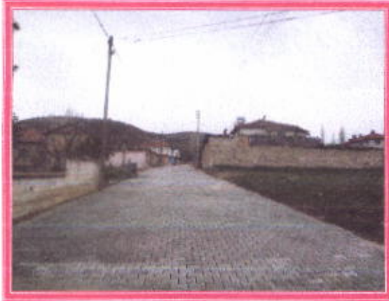
Yıldırım Beyazıt Caddesi

Belediyemiz tarafından İlçemiz içerisindeki yollara parke taşı döşenmesi için belediyemiz tarafından parke taşı alımı ihalesi yapıldı ve 240.000,00.-TL parke taşı alınarak belediyemiz kendi imkanları ile ilçemiz Saray Mahallesinde Yıldırım Beyazıt Caddesi, Dr.Sadık Ahmet Sokağı,Konak Mahallesinde Kavuk Sokak, Vezir Sokak, Dere Sokak, Kebabcı Sokak,Bülbül Sokak, Şenol Sokak ve Kiraz Sokak. Yenicami Mahallesinde Atatürk Caddesi,Pınar Sokak, Erdem Sokak, Gelepli Sokak, Zafer Sokak, Çınar Sokak Ufuk Sokak Ziraat Sokak, Bahçe Sokak ve Uysal Sokaklarına kilit parke taşı döşemesi yapılarak güzel bir görünüme kavuşturuldu.