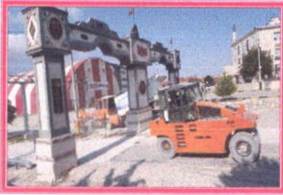
İlçemiz Girişi Kara Yolu asfalt çalışması

Belediyemiz tarafından İlçemiz Kemer Burdur arası Kemer çıkışı kara yol çok dar olduğu için Belediyemiz tarafında konu Burdur İl Planlama ve Koordinasyon Kurulu Toplantısında konu Belediye Başkanımız tarafında Vali ve Kara Yolları Bölge Müdürüne iletildi Vali beyin talimatı ile yol genişleme ve asfaltlama işlemi başlamış olup 2018 yılı içerisinde yaklaşık 16 Km'lik kısmı genişleme ve asfaltlama yapılmış olup, geri kalan kısmı 2019 yılında tamamlanacak.