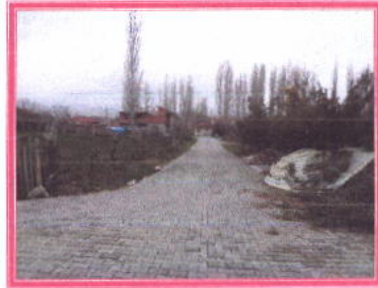
Dr.Sadık Ahmet Sokağı