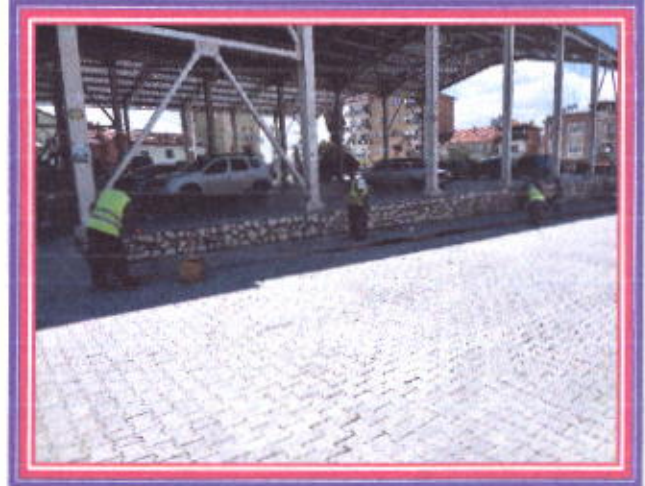
İlçemiz İçerisindeki Bordür Taşların boyanması