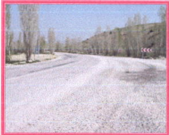
Kara Yolunun Yeni Hali