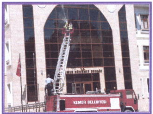
Kamu Binaları Dış Cephe Temizliği