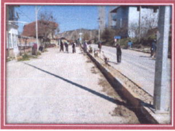
İlçemiz İçerisindeki Yolların Temizlenmesi

Belediyemiz tarafında İlçemiz içerisindeki Park, Bahçe yol kenarları ve kaldırımlar Belediyemizde çalışan İş-Kur İşçileri tarafından Otların biçilerek toplanması, Ağaçların budaması yapılarak çapalanması ve temizlenmesi yapılarak güzel bir görünüme kavuşturuldu.