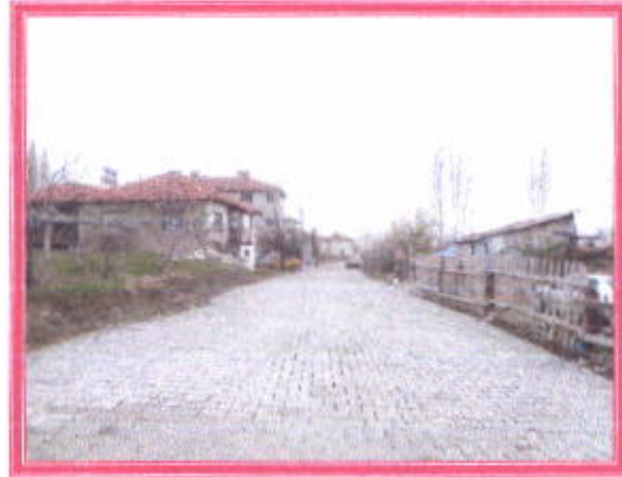
Yıldırım Beyazıt Caddesi