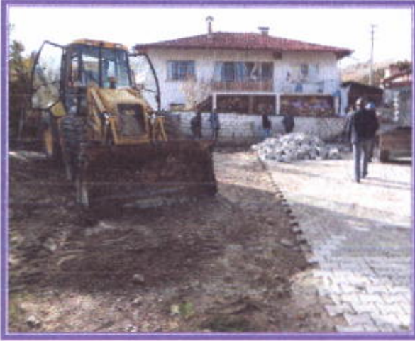
Arızalanan yolların tadilatı

İlçemiz içerisindeki Cadde ve sokaklardaki yollarda bozulan ve arzalanan parke taşların sökülerek yeniden döşemeleri yapıldı. İçme suyunda arızalanan patlayan boruların yapılması ve yine Kanalizasyon arızalarının giderilmesi belediyemiz personeli tarafından yapılmıştır.