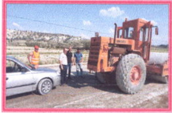
İlçemiz Girişi Kara Yolu asfalt çalışması