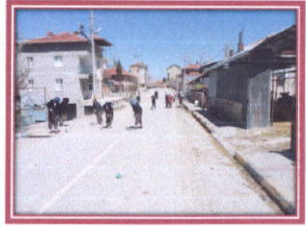
İlçemiz İçerisindeki Yolların Temizlenmesi