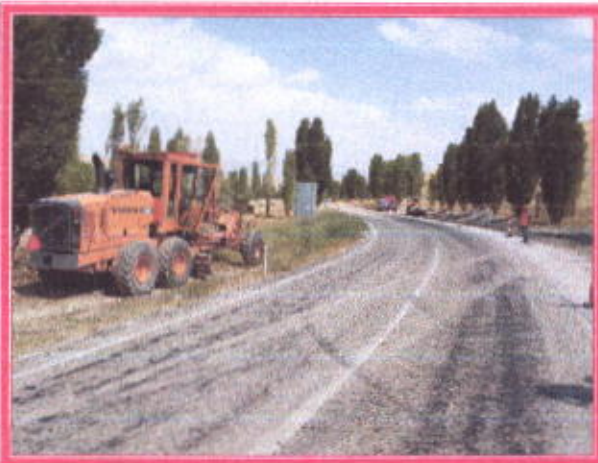
Kara Yolunun Eski Hali