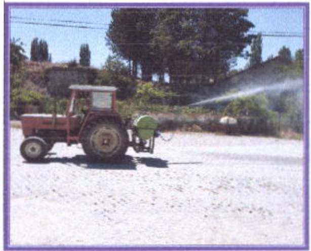
İlçe içi yollar İlaçlama