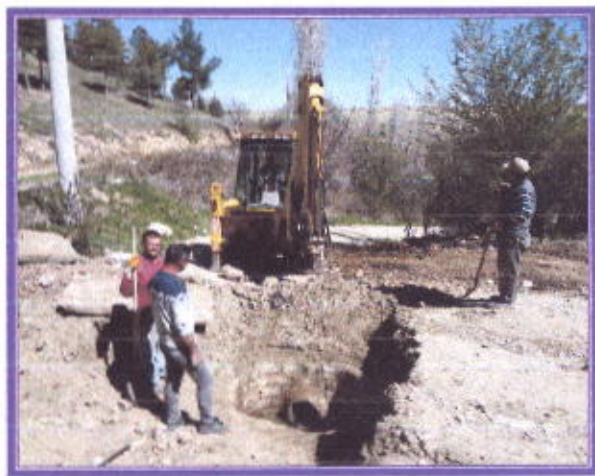
Kanalizasyon arızasının giderilmesi