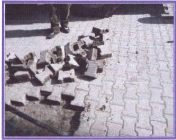
Arızalanan yolların tadilatı