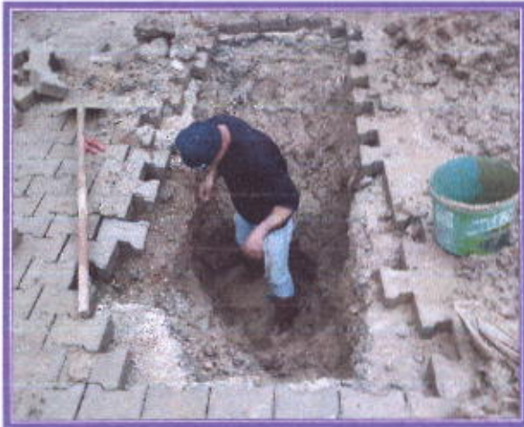
İçme suyunun arızasının giderilmesi