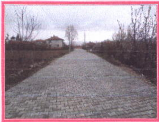
Yıldırım Beyazıt Caddesi