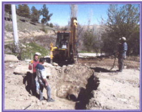
Kanalizasyon arızasının giderilmesi