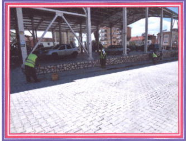
İlçemiz İçerisindeki Bordür Taşların boyanması