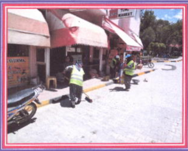
İlçemiz İçerisindeki Bordür Taşların boyanması