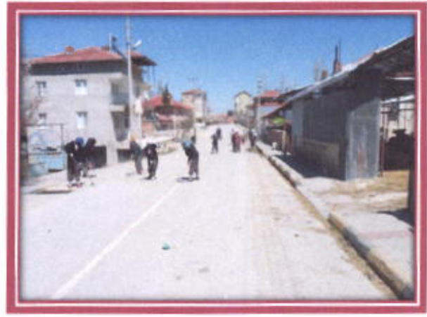
İlçemiz İçerisindeki Yolların Temizlenmesi