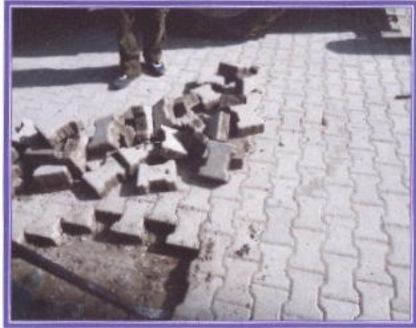
Arızalanan yolların tadilatı