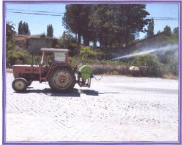
İlçe içi yollar İlaçlama