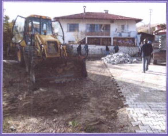
Arızalanan yolların tadilatı

İlçemiz içerisindeki Cadde ve sokaklardaki yollarda bozulan ve arızalanan parke taşların sökülerek yeniden döşemeleri yapıldı. İçme suyunda arızalanan patlayan boruların yapılması ve yine Kanalizasyon arızalarının giderilmesi belediyemiz personeli tarafından yapılmıştır.