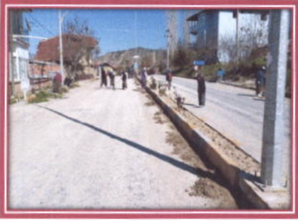
İlçemiz İçerisindeki Yolların Temizlenmesi

Belediyemiz tarafında İlçemiz içerisindeki Park, Bahçe yol kenarları ve kaldırımlar Belediyemizde çalışan İş-Kur İşçileri tarafından Otların biçilerek toplanması, Ağaçların budaması yapılarak çapalanması ve temizlenmesi yapılarak güzel bir görünüme kavuşturuldu.