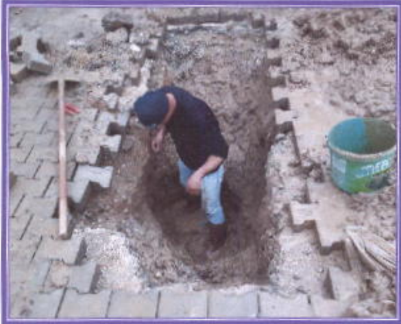
İçme suyunun arızasının giderilmesi